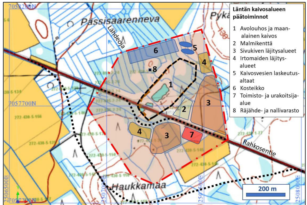
Kuva 1. Läntän kaivosalueelle sijoittuvat päätoiminnot. Kaivosaluerajaus on esitetty punaisella katkoviivalla ja tielinjausten muutokset mustalla katkoviivalla.

Läntän kaivosalueelle sijoittuvat päätoiminnot on esitetty kuvassa 1. Hakemusasiakirjoissa on kuvattu myös mm. suunniteltuja louhintamenetelmiä ja malmin kuljetusta sekä rikastusta ja malmirikasteen jatkojalostussuunnitelmia. Lisäksi on esitetty arviot Läntän avolouhoksen ja maanalaisen kaivostoiminnan louhintamääristä. Hakija on myös antanut selvityksen kaivos- ja rikastamoalueen sulkemiseen ja jälkikäyttöön liittyvistä seikoista.