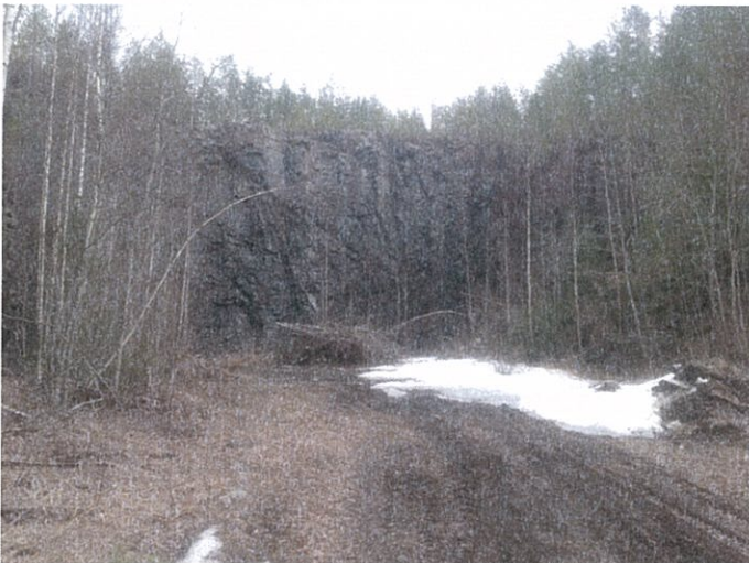
Kuva 2. Avolouhosjyrkäne kaivospiirin käyttöalueen eteläosassa.