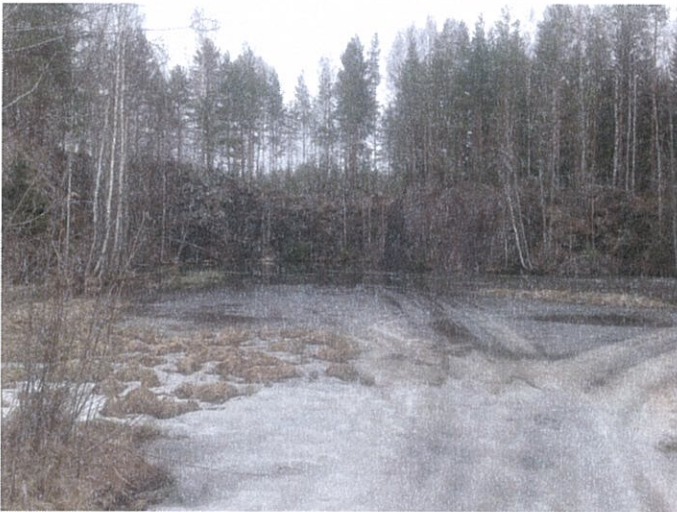
Kuva 1. Pienempi avolouhosjyrkäne kaivospiirin pohjoisosassa.

Ympäristöviranomaisen ei näe tarvetta ympäristönsuojelulain tarkoittamille jälkihoitovelvoitteille tai seurannalle.