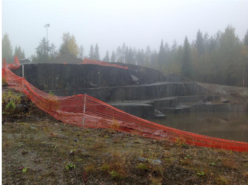
Kuva 2. Aidattava louhosjyrkäne ja maapenkereen luiskausalue kuvan oikeassa reunassa.