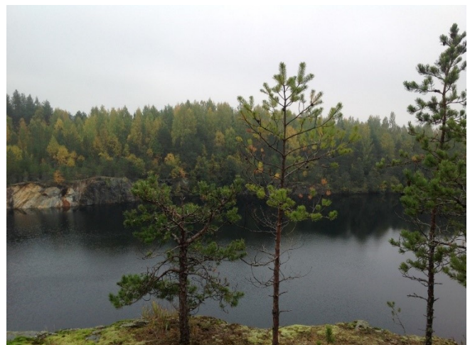
Kuvat 1 ja 2: Solan kaivospiirin louhosalue