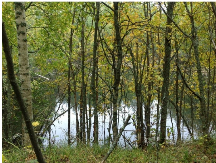
Kuva 4: Vanha vesienkäsittelyallas