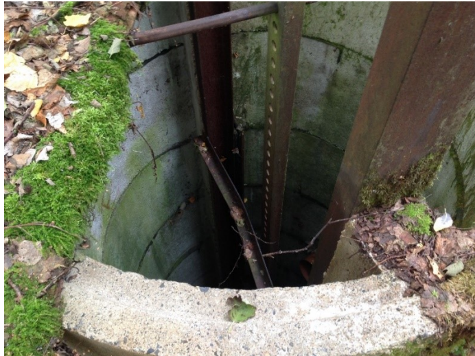
Kuva 3: Vanha vesienkäsittelyyn liittyvä kaivo