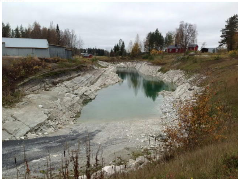
Kuva 1. Kaivosalue.

murskaimesta asunto sijaitsee noin 200 m päässä ja loma-asunto noin 250 m päässä.