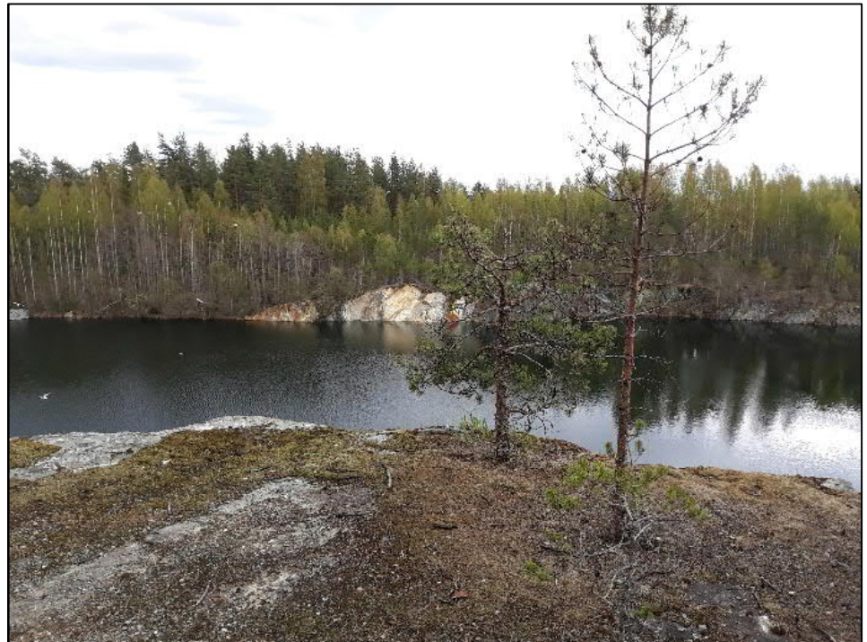
Kuva 1: Solan kaivospiirin avolouhos