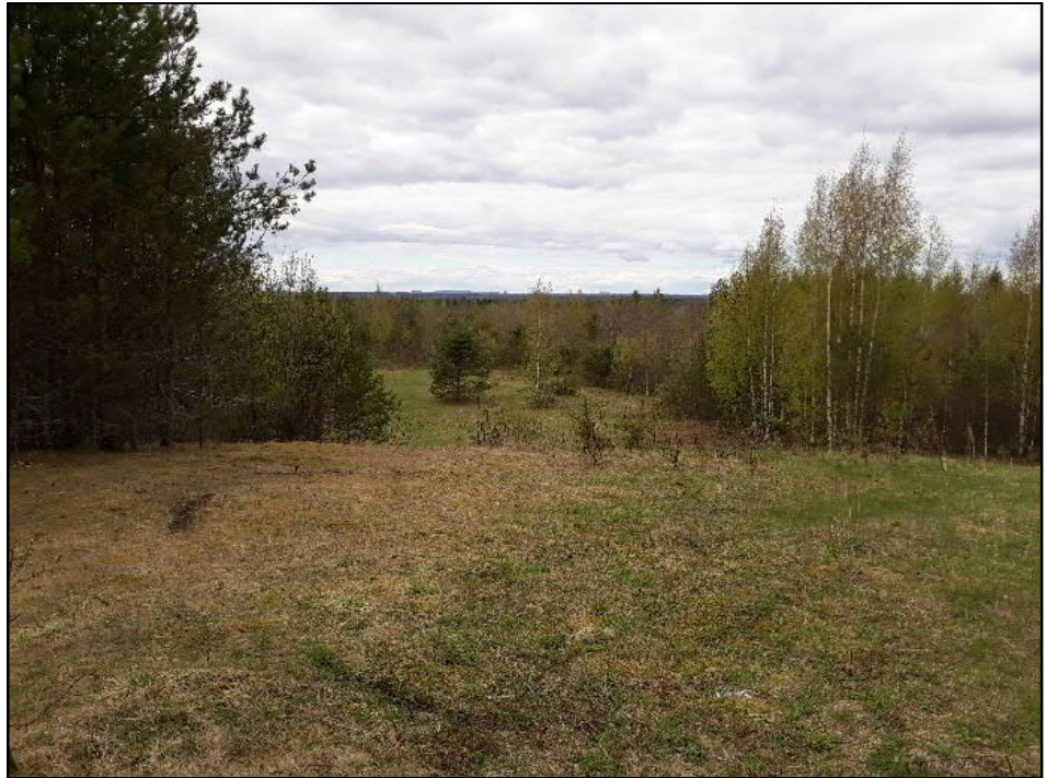
Kuva 2: Maisemoitu läjitysalue Solan kaivospiirillä