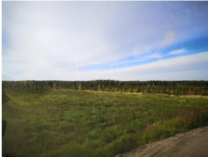
Kuva 3. Rikastushiekka-aluetta.

Alueille johtavat tiet on suljettu lukituilla puomeilla (5 kpl). Rikastushiekka-alueet ovat yleisen turvallisuuden edellyttämässä kunnossa. Rikastushiekka-alueella ei saa kasvaa puustoa pintarakenteiden säilyttämiseksi.