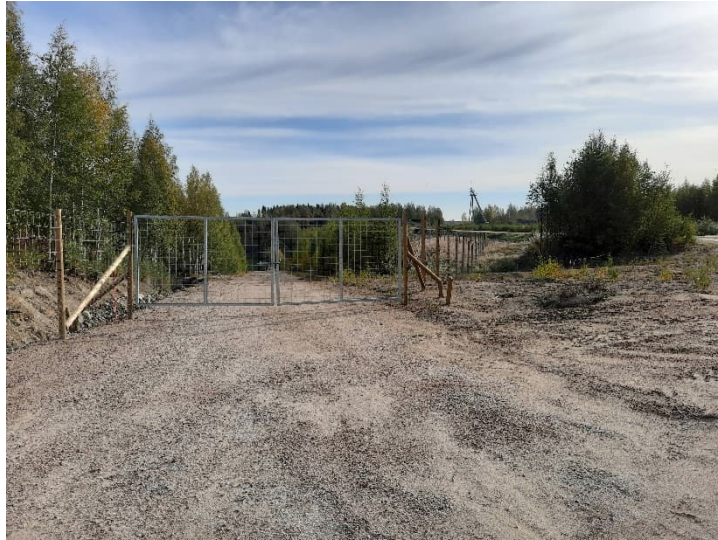
Kuva 2. Avolouhoksen ympärillä olevaa aitaa ja portti.

Avolouhos on yleisen turvallisuuden edellyttämässä kunnossa. Sortumavaarasta johtuen aidatun alueen sisäpuolelle meneminen on kielletty.