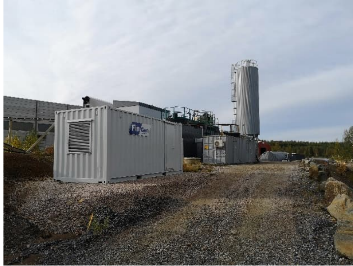
Kuva 4. Vesienkäsittelylaitos.