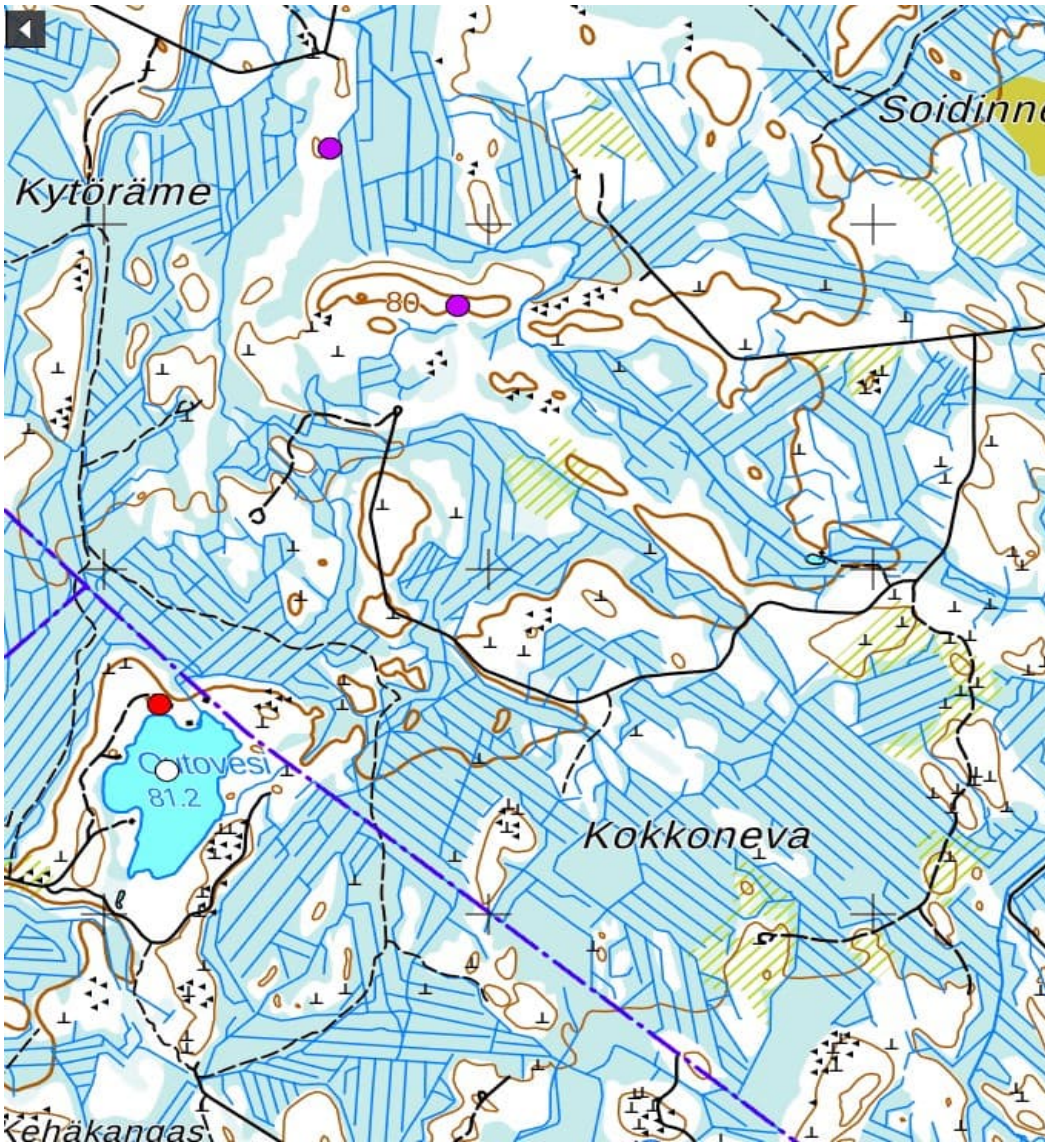
Liite 1. Kokkonevan malminetsintäalueelta ja sen läheisyydestä tiedossa olevat arkeologiset kohteet. Punaiset pisteet ovat tiedossa olevia maastossa tarkastettuja kiinteitä muinaisjäänöksiä. Violetit pisteet ovat lidarkarttojen perusteella rekisteröityjä mahdollisia muinaisjäänöksiä (tervahautoja).