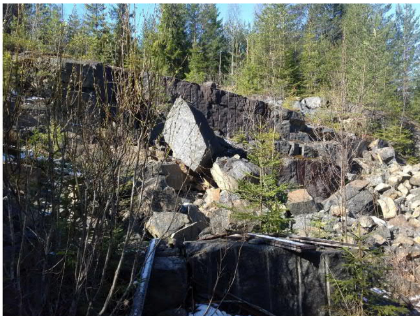
Kuva 1. Mustikkamäen louhoksen louhinta-alue.