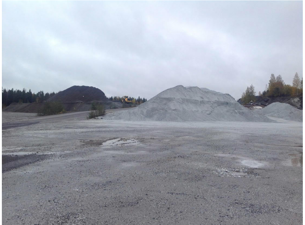
Kuva 2. Tuotekenttä Siikaisten kaivospiirillä.