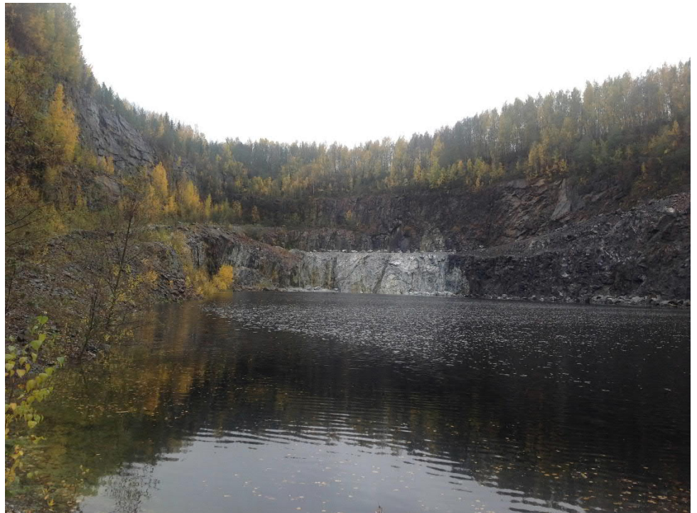
Kuva 1. Siikaisten avolouhos.

Kaivosviranomainen on suorittanut katselmuksen Siikaisten kaivospiirillä 16.10.2019. Katselmuksessa on todettu louhoksen ja tuotekasojen sekä louhoksen aitauksen olevan asianmukaisessa kunnossa (kuvat 1 ja 2). Kalkkitehdas ja konttori sijaitsevat yksityishenkilöiden mailla (kuva 3). Kaivosyhtiö on pyytänyt tarjouksen rakennusten purkamiseksi.