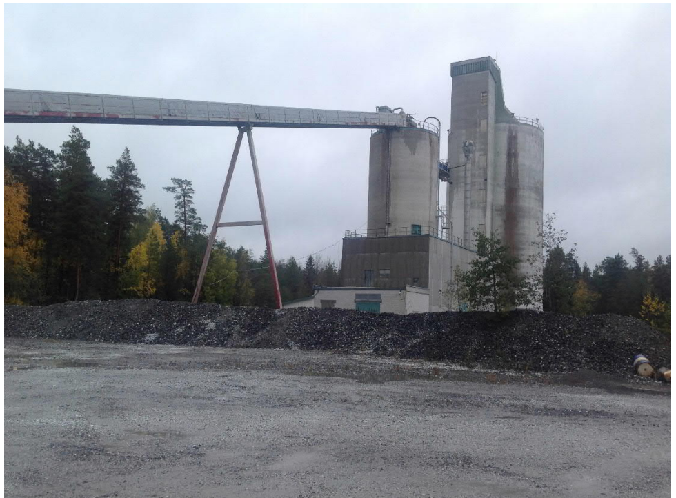
Kuva 3. Kalkkitehdas Siikaisten kaivospiirillä.