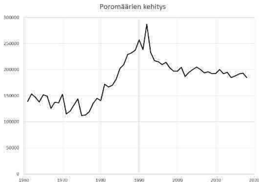
Kuva 1. Poromäärien karkea arvio 1960 - 2018 ajalle arvioitu lukuporoista poronhoitovuoteen 1991/1992 asti ja sen jälkeen eloporoista.