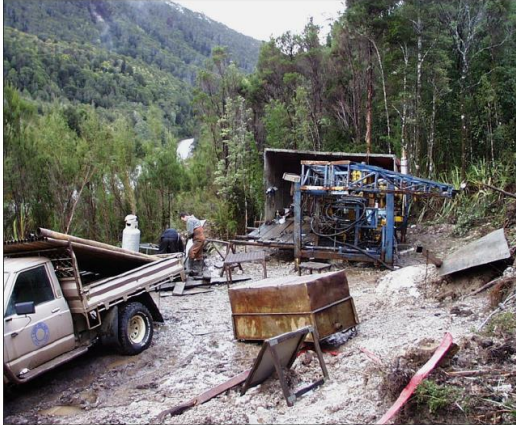
Drill site rehabilitation adjacent to Jukes Road — July 2001

(Lähteenä "Mineral Exploration Code of Practice", Mineral Resources Tasmania, Fifth Edition. Saatavilla: http://www.mrt.tas.gov.au/mrtdoc/dominfo/download/MECOP5/MECOP5.pdf )