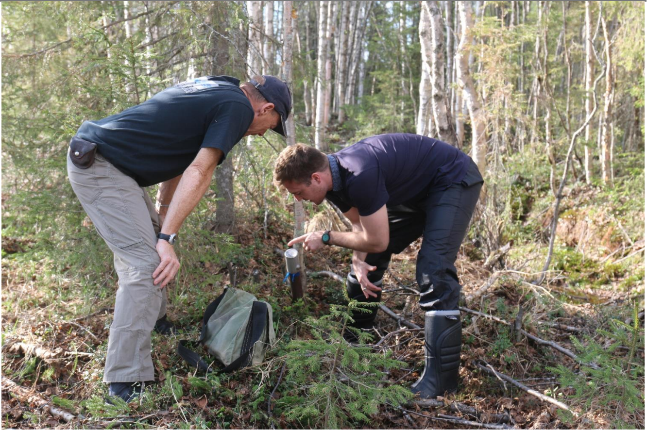
Kuva 5. Timanttikairausputken pää (tummanruskea), jonka päähän on asetettu hattu (hopeinen) maastossa, kairaukset ovat päättyneet.