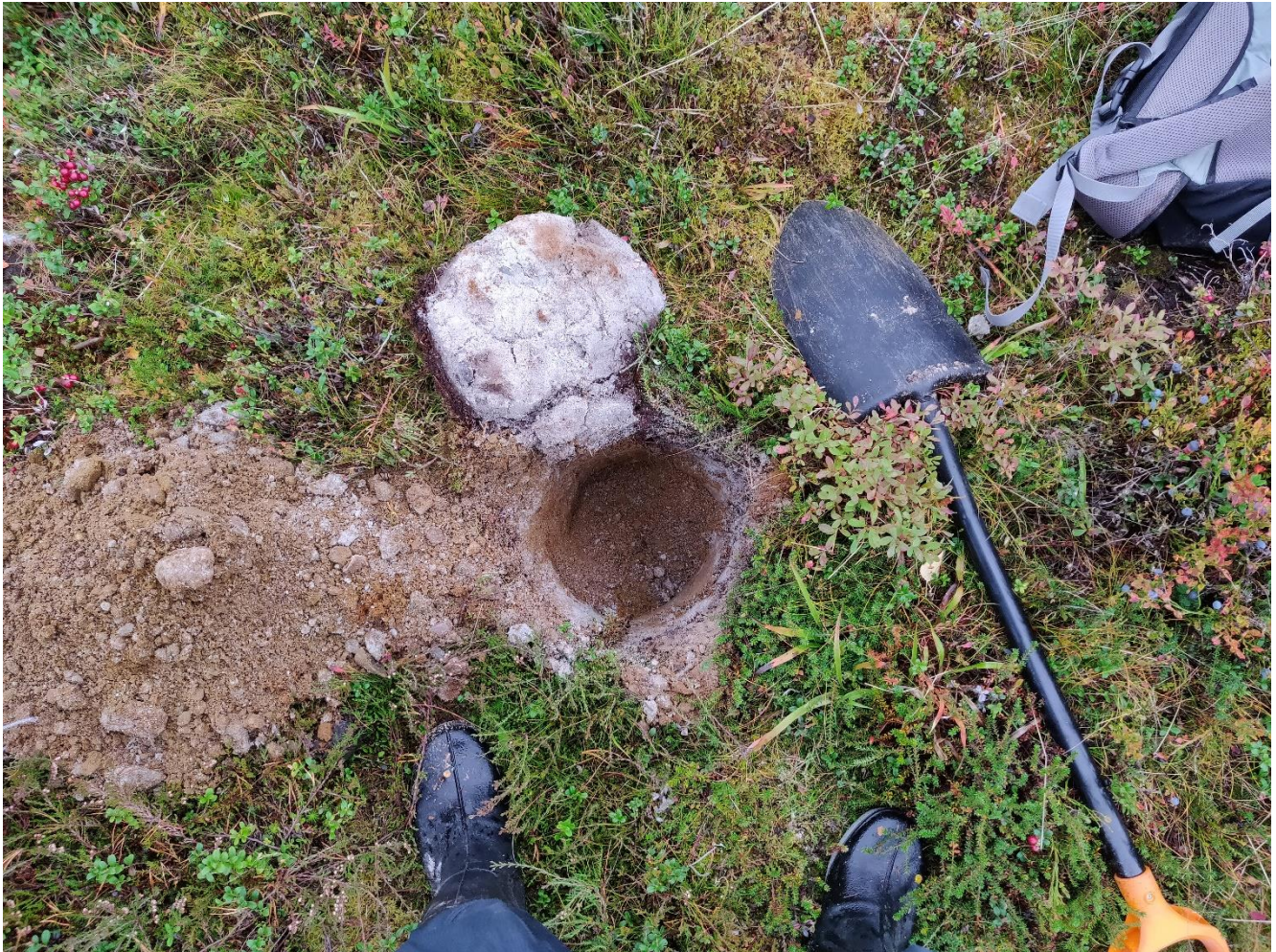
Kuva 3. Maaperänäytteenottoa lapiolla. Erillään pintamaa (kansi) ja toisessa kasassa syvemmät kerrokset, jotka sijoitetaan näytteenoton jälkeen samassa järjestyksessä takaisin kuoppaan.

Merkkikepit poistetaan alueelta tutkimusten päätyttyä.