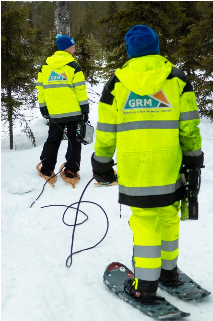
Kuva 4. Sähkömagneettista mittausta maastossa talviaikaan.

vähän jälkiä. Käytetyt kaapelit, anturit ja merkkikepit poistetaan alueelta ja kuopat täytetään. Lisätietoa löytyy liitteessä 1.