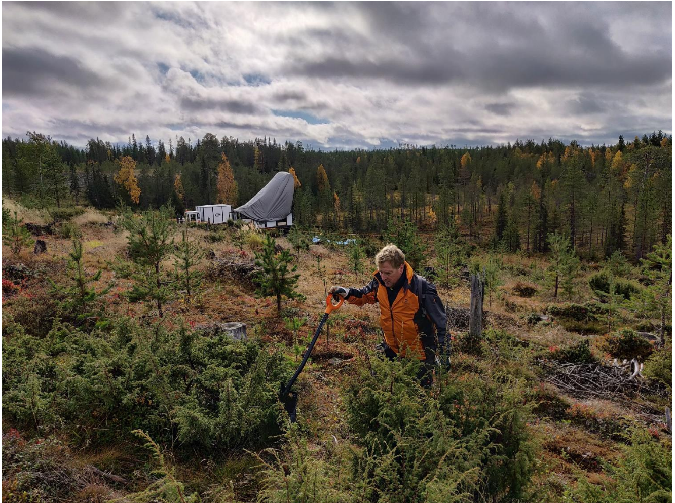
Kuva 6. Taustalla timanttikairauskalustoa: telaketjujalustainen kairakone ja tukiajoneuvo.

Jätekaivojen paikalta poistettu maaperä varastoidaan kaivon viereen, tavoitteena erottaa pintamaa ja pohjamaa. Kun kairaus on päättynyt, jätekaivo tyhjennetään, kairaussoija toimitetaan jätteenkeräykseen ja kuoppa ennallistetaan ensin pohjamaalla ja sitten pintamaalla.