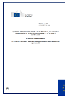
Joulukuu 2025 RESourceEU Action Plan