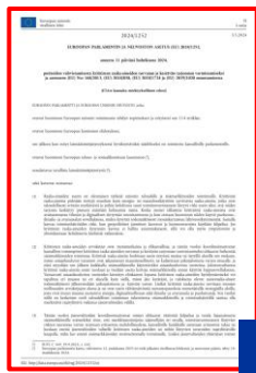
Toukokuu 2024 (CRMA)