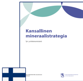
Joulukuu 2024 (mineraalistrategia)