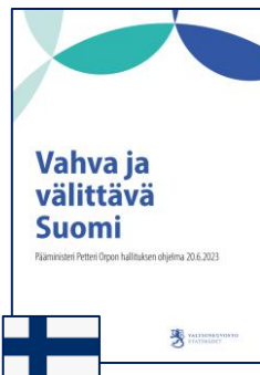
Kesäkuu 2023 (hallitusohjelma)

”Hallitus kartoittaa ja hyödyntää Suomen valtteja kriittisiin raaka-aineisiin liittyen laatimalla mineraalistrategian , joka vahvistaa omavaraisuutta ja turvaa raaka-aineiden saannin myös yllättävissä markkinahäiriöissä.”