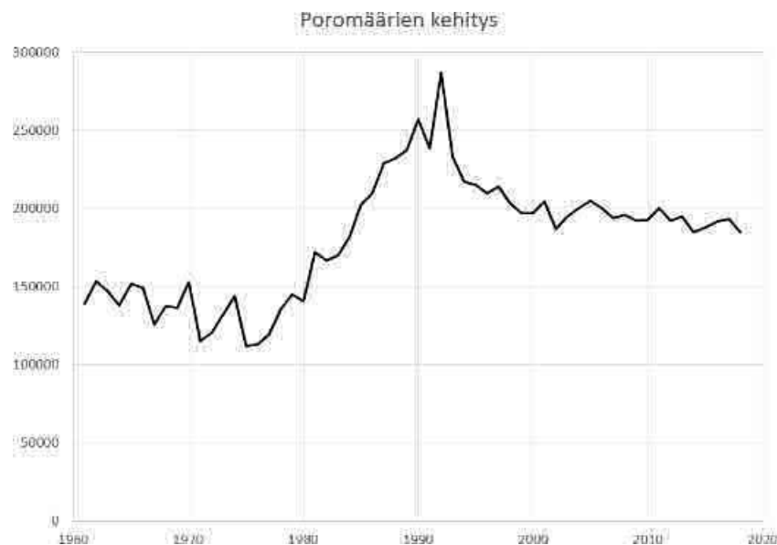
Kuva 1. Poromäärien karkea arvio 1960 - 2018 ajalle arvioitu lukuporoista poronhoitovuoteen 1991/1992 asti ja sen jälkeen eloporoista.