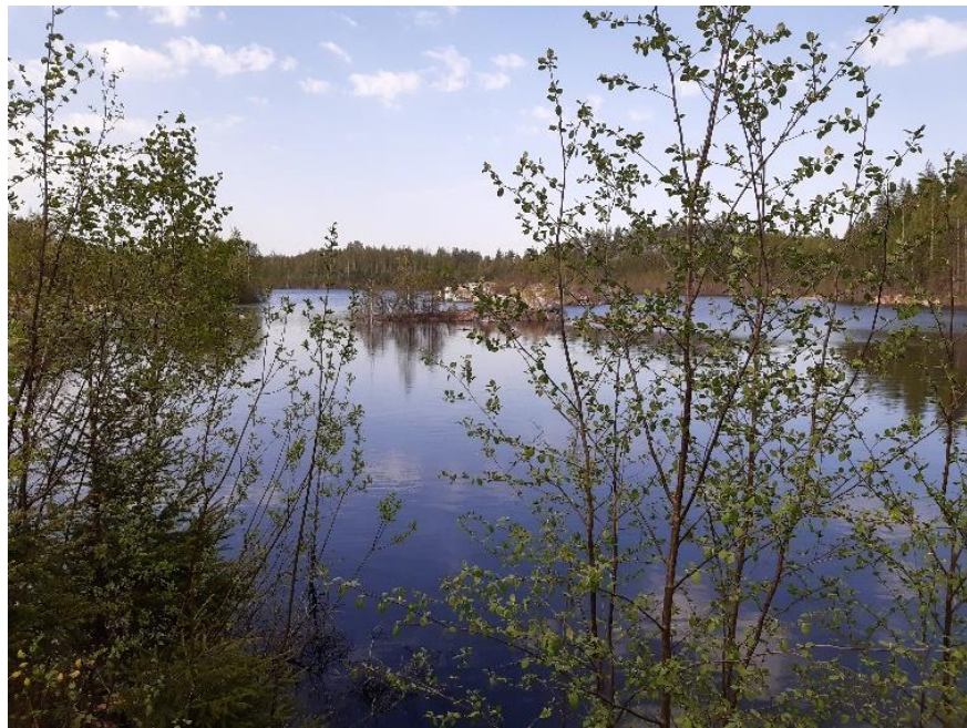
Kuva 1. Lipasvaaran vedellä täytynyt avolouhos (Tukesin katselmus alueella 19.5.2021).

Tukesin katselmuksessa on perehdytty edellä kuvattuun suunnitelmaan koelouhinnan toteuttamiseksi ja tarkastettu koko kaivospiiri kaivosvakuuden suuruuden määrittämiseksi (kuvat 1-2).