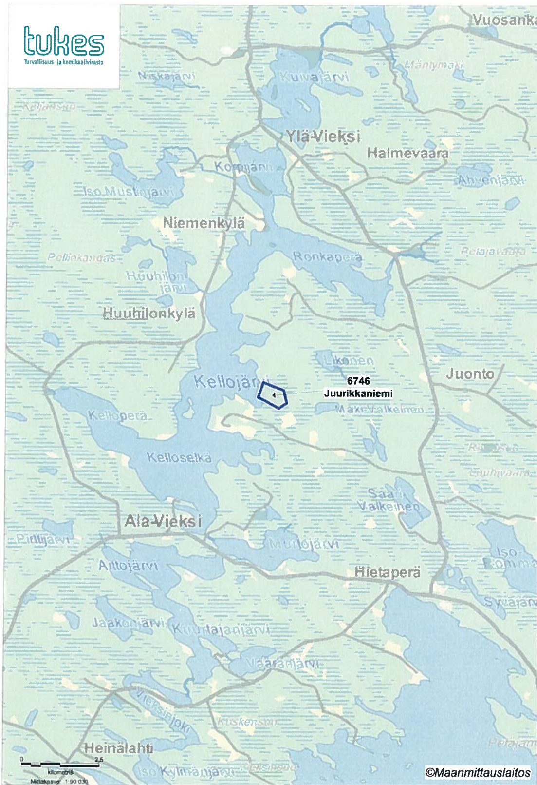
Kartta 1: Juurikkaniemi-kaivospiiri KaivNro 6746 / KL2015:0010