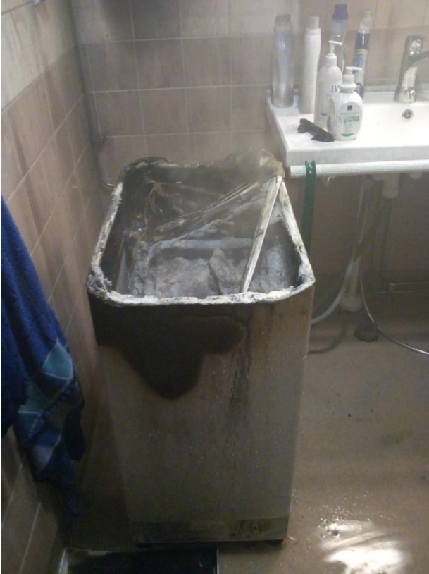
Tapaus 12: WC:ssä syttynyt pesukone palon jälkeen

PELASTUSLAITOSTEN KUMPPANUUSVERKOSTON JULKAISU 2/2018