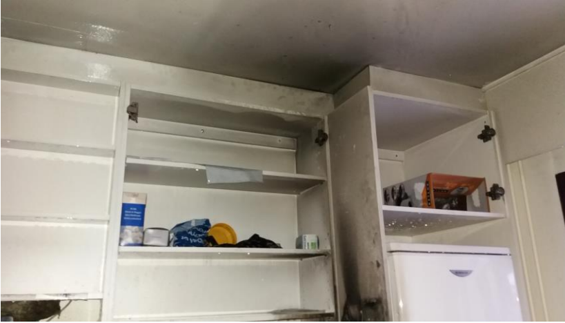
Tapaus 8: Palon jäljiltä on nähtävissä nokea

PELASTUSLAITOSTEN KUMPPANUUSVERKOSTON JULKAISU 2/2018