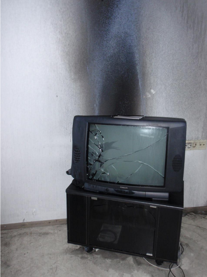
Tapaus 9: Televisio palon jälkeen

PELASTUSLAITOSTEN KUMPPANUUSVERKOSTON JULKAISU 2/2018