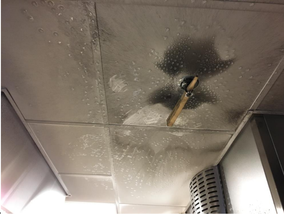
Tapaus10: Palokunnan asettama kiila launneeseen suuttimeen

PELASTUSLAITOSTEN KUMPPANUUSVERKOSTON JULKAISU 2/2018