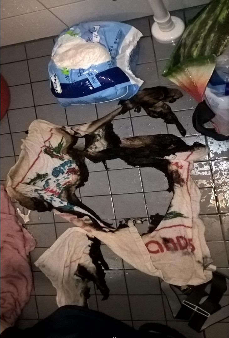
Tapaus 7: Palaneet pyyhkeet lattialla palon jälkeen

PELASTUSLAITOSTEN KUMPPANUUSVERKOSTON JULKAISU 2/2018