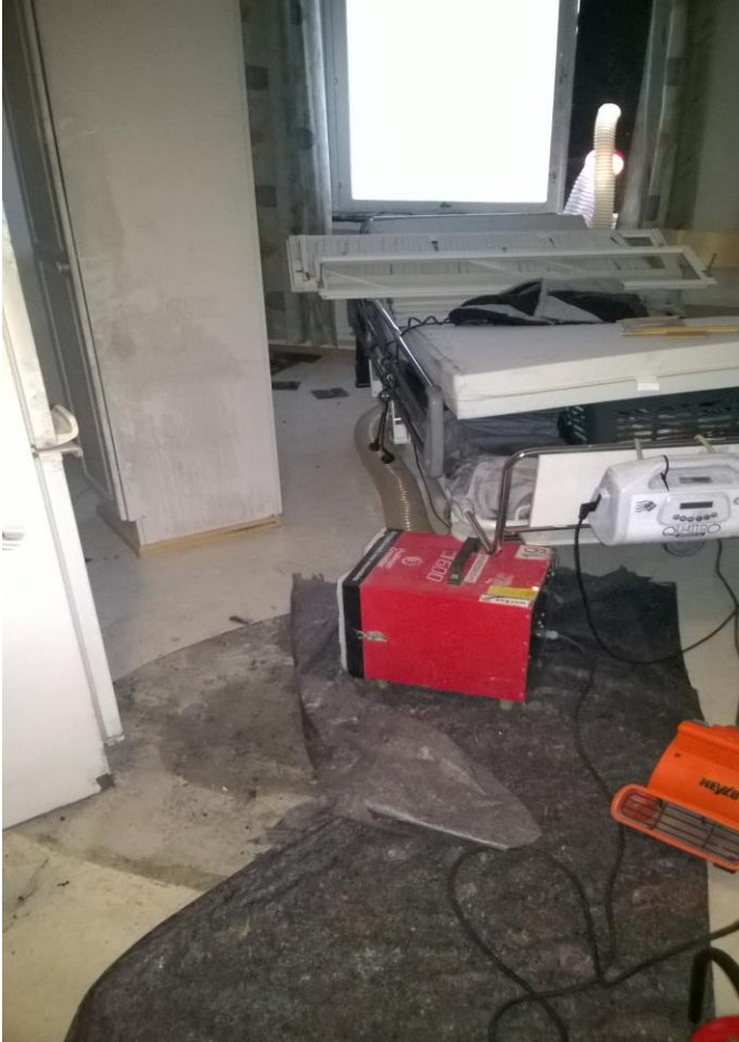
Tapaus 1: Sytytetty tulipalo oli lattialla punaisen lämmittimen kohdalla. Kuva on otettu huoneiston ovelta.

PELASTUSLAITOSTEN KUMPPANUUSVERKOSTON JULKAISU 2/2018