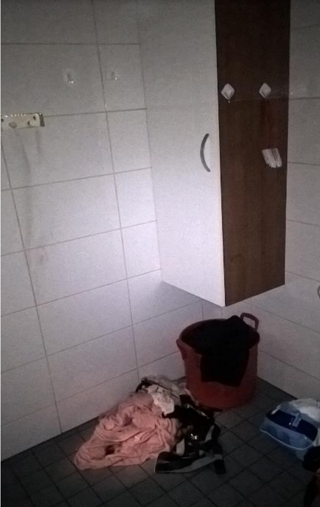
Tapaus 7: Kuvassa seinäkoukut, jossa olleet pyyhkeet asukas sytytti palamaan

PELASTUSLAITOSTEN KUMPPANUUSVERKOSTON JULKAISU 2/2018