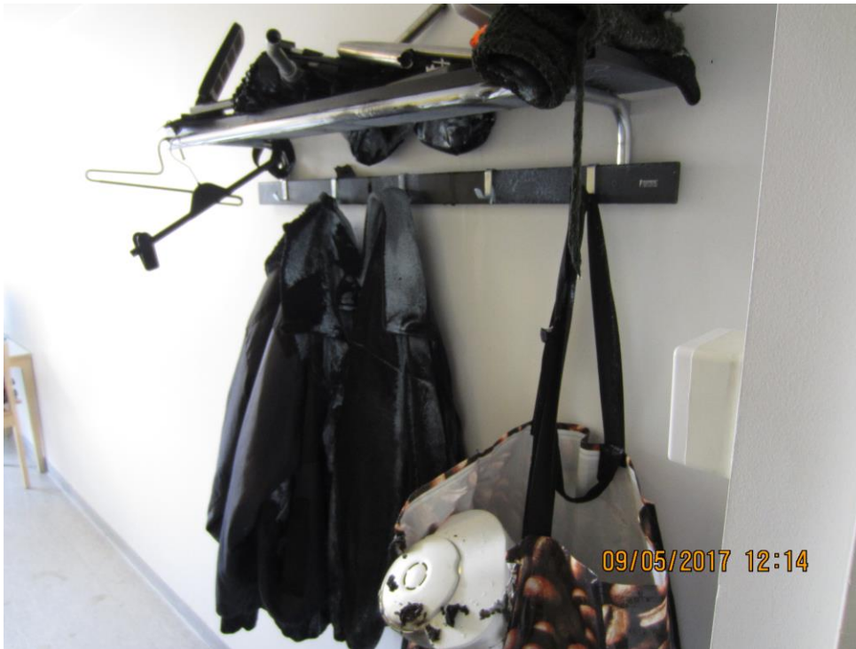
Tapaus 4: Kassi paloi asunnon eteisen naulakossa, tahallinen

Jos asunnossa ei olisi ollut automaattista sammutuslaitteistoa, olisiko työntekijä voinut mennä asuntoon sammuttamaan ja pelastamaan asukasta? Siihen ei voi ottaa kanta varmasti. Mahdollisesti tai sitten ei. Asukas ei joka tapauksessa tehnyt mitään pelastuakseen palosta