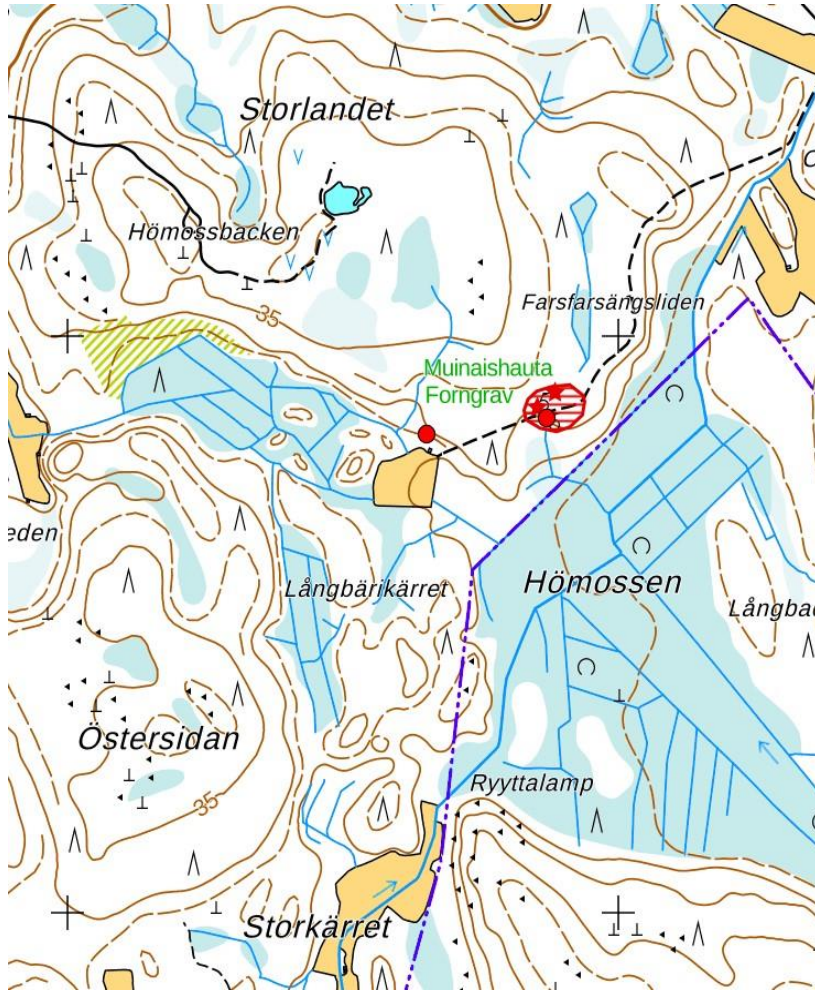
Liite 1. Malminetsintäalueen tiedossa olevat kiinteät muinaisjään- nökset merkittynä punaisella.